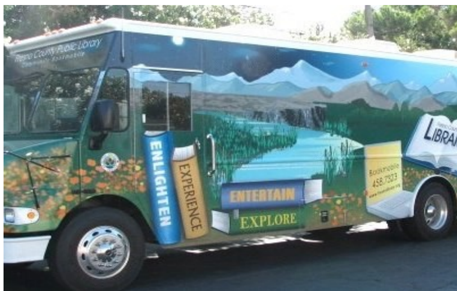
Pojazdná knižnica v USA

"Free" knižnica na ulici - Manila, Filipíny... Táto knižnica pod holým nebom vznikla náhodne, jej zakladateľ si myslel, že knihy sa rozkradnú, ale opak sa stal pravdou